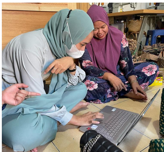
Gambar 5. Pendampingan Pelaporan Keuangan secara Digital

Pada kegiatan edukasi kesehatan ini, pengelola Kelompok Pengrajin Purun Al Firdaus juga menyempatkan untuk meminta bimbingan dari tim pengabdian terkait pelaporan keuangan secara digital. Hal tersebut dikarenakan mereka telah disetujui untuk membuka Koperasi oleh Dinas Koperasi Kotamadya Banjarbaru untuk memfasilitasi kebutuhan anggotanya sehingga diharuskan untuk membuat laporan rutin. Selama ini mereka membuat laporan secara manual mencatat dalam pembukuan yang kemudian diharuskan untuk beralih membuat secara digital.