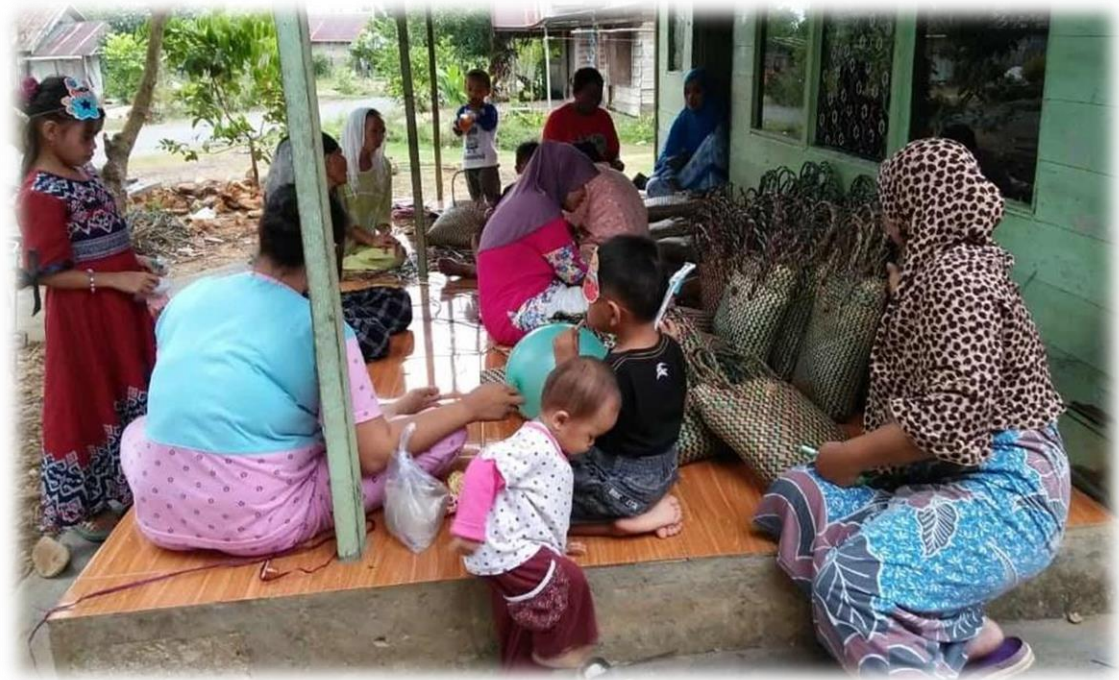
Gambar 4. Kegiatan Edukasi Kesehatan

Semua kegiatan yang dilaksanakan untuk memberikan pencerahan mengenai edukasi dampak media sosial terhadap kesehatan mental seseorang di masa pandemi, ini telah memberikan solusi sesuai dengan permasalahan yang ada, sehingga pengrajin Purun Al Firdaus dapat memahami apa yang belum mereka tahu dengan jelas tentang hal tersebut dan menjadikan Pengabdian Kepada Masyarakat (PKM) ini dapat bermanfaat bagi mereka.