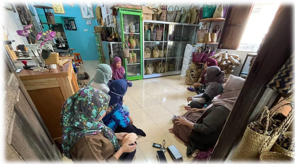
Gambar 3. Koordinasi dengan Pengelola Kelompok Pengrajin Purun Al Firdaus

Pada jadwal dan waktu yang telah ditentukan tersebut, dilaksanakan kegiatan penyuluhan tentang dampak media sosial terhadap kesehatan mental selama masa pandemi. Adapun materi yang disampaikan antara lain: