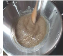
Mengental Sari Kencur