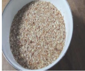
Rendaman Kencur 30'