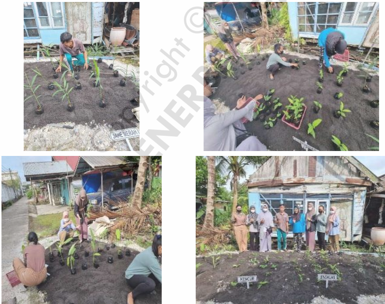
Gambar 3.3 Budidaya Jahe Merah, Kencur, Kunyit dan Lengkuas

Panen dilakukan setelah tanaman berumur 10-12 bulan. Tanaman lengkuas yang siap panen memiliki ciri-ciri daun yang mulai layu. Panen dilakukan dengan cara membongkar rimpang dengan rimpang garpu tanah, lalu garpu diangkat ke atas secara perlahan. Lengkuas yang telah dipanen lalu dibersihkan dengan cara dipukul pelan-pelan untuk memisahkannya dari kotoran.