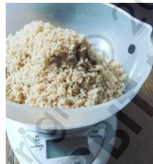
Timbang Kristal Kencur