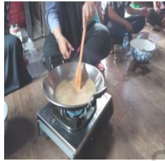
Pemanasan Sari Kencur