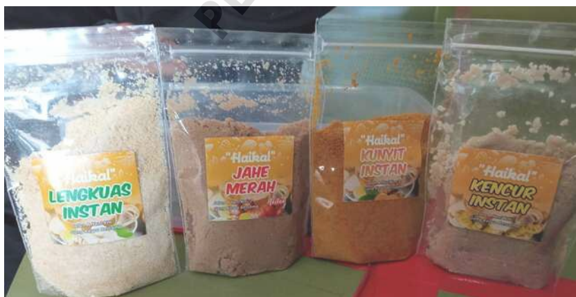
Gambar 2.1 Serbuk Instan Siap Seduh

Produk inovasi jamu tradisional serbuk instan bisa dikemas sebagai berikut: