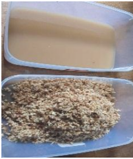
Rendam Sari Kencur 2