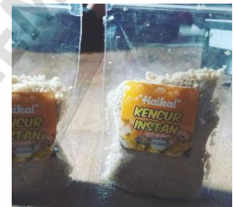
Pengemasan Serbuk Kristal Kencur