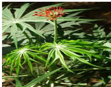
Gambar 1. Tanaman yodium (Barbosa et al. ,2010).

Tanaman yodium pertama ditemukan di Meksiko, ditanam sebagai tanaman hias kadang ditemukan tumbuh liar, daunnya mirip dengan daun singkong atau papaya. Semak atau pohon kecil dengan batang tunggal dan tinggi khas 6-10 ft (1,8-3,1m), meskipun dapat tumbuh hingga 200 kaki (6,1m) tinggi. Daun sangat khas besar, tumbuh hingga 12 in (30,5cm) lebar. Maka dipotong dalam ke 7 -11 lobus sempit dengan margin masing-masing lobus menjadi sagemen sempit. Berwarna hijau gelap di atas dan di bawah berwarna keputihan. Bunga-bunga berwarna merah cerah tangkai bunga tinggi di atas dedaunan. Bunga tanaman ini majemuk. Bunga muncul pada ujung cabang dengan dengan panjang tangkai bunga sekiatar 1-5cm. batang bunga berwarna hijau dan jika tua berwarna coklat. Tanaman ini mempunyai biji yang berbentuk bulat berwarna putih saat masih muda dan berwarna coklat ketika sudah tua.