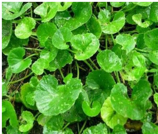
Gambar 1 : Tanaman Pegagan

Pegagan ( Centella asiatica (L.)Urban) merupakan tanaman herba tahunan yang tumbuh di daerah tropis dan berbunga sepanjang tahun. Bentuk daunnya bulat seperti ginjal manusia, batangnya lunak dan beruas, serta menjalar hingga mencapai satu meter.